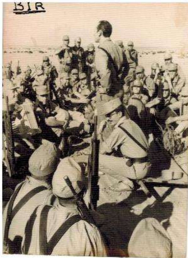
Teórica en el Sahara