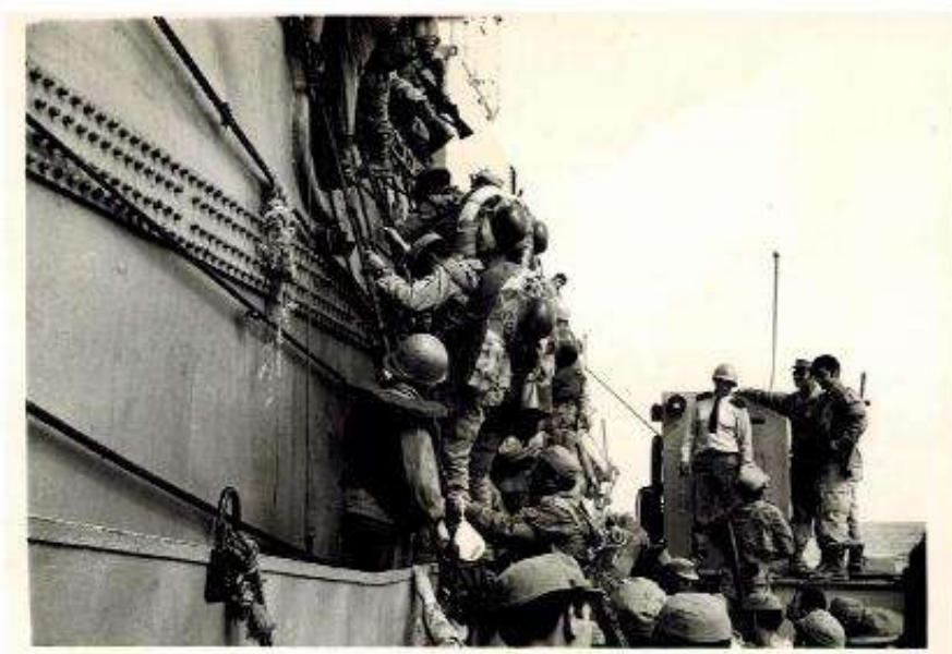
Embarcando por las redes