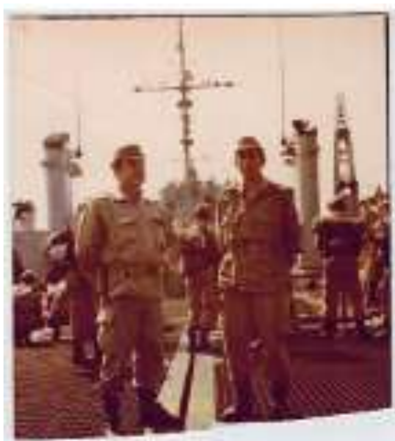
Embarcados en el Galicia