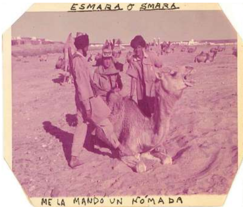
ESMARA O SMARA

Los destinos eran muy diferentes. La Legión y la Bandera Paracaidista eran por captación. La Policía Territorial era destino desde la Caja de Reclutas. Por selección los destinos eran: Nómadas, Artillería, Ingenieros, Intendencia... todos ellos muy necesarios y complementarios.