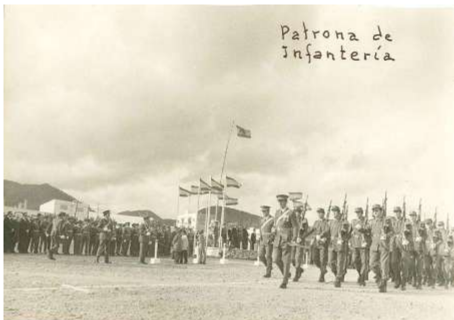
Trabajar se trabaja

Realizamos Ejercicios Tácticos de Batallón, en diferentes lugares de la isla, incluso los realizamos en distintos lugares de la península. Ejercicios de Guerrillas, en plan de supervivientes.